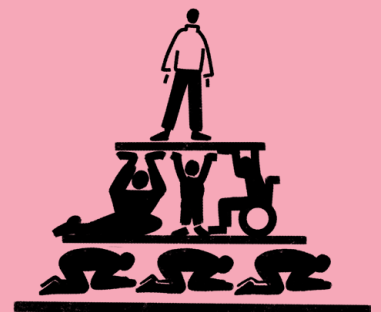
MACHTVERHÄLTNISSE UND SOZIALE STRUKTUREN